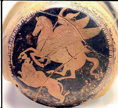
Bellérophon combattant la Chimère . Scène peinte sur l'extrémité d'un épinétron attique, V e siècle av. J.-C.