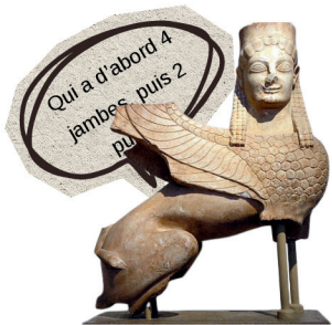
Sphinx funéraire archaïque, vers 570 av. J.-C. (Musée national archéologique d'Athènes).