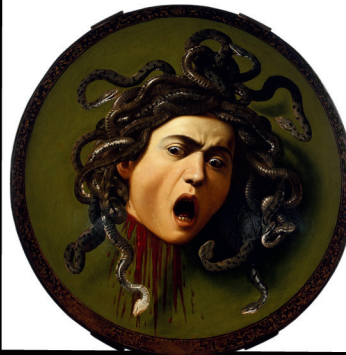
Méduse Caravage 1597 - 1598 Huile sur toile de lin Musée des Offices, Florence (Italie)