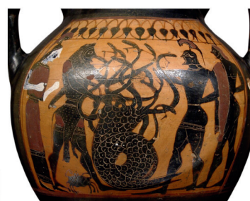
Héraclès et l' Hydre de Lerne , amphore attique à figures noires, - 540, musée du Louvre.