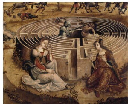
Thésée et le Minotaure (XVI e siècle) Italie, École de Maître des cassoni Campana