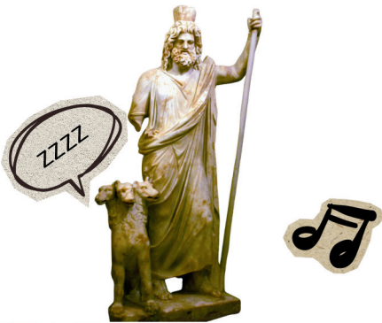
Statue montrant Cerbère aux côtés d'Hadès. Musée archéologique d'Héraklion.