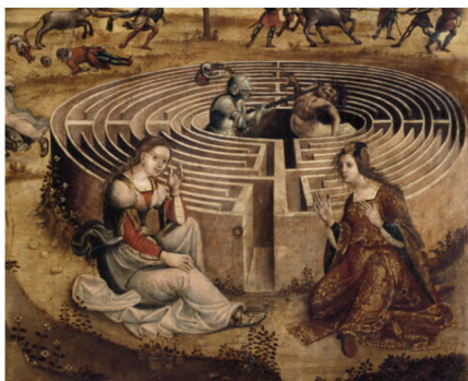
Thésée et le Minotaure (XVI e siècle) Italie, École de Maître des cassoni Campana