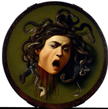
Méduse Caravage 1597 - 1598 Huile sur toile de lin Musée des Offices, Florence (Italie)