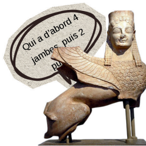
Sphinx funéraire archaïque, vers 570 av. J.-C. (Musée national archéologique d'Athènes).