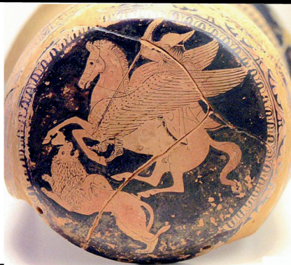
Bellérophon combattant la Chimère . Scène peinte sur l'extrémité d'un épinétron attique, V e siècle av. J.-C.