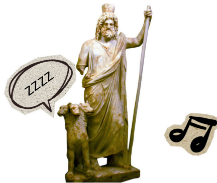
Statue montrant Cerbère aux côtés d'Hadès. Musée archéologique d'Héraklion.