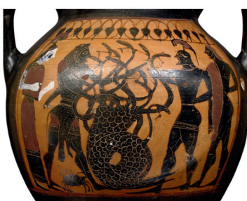
Héraclès et l' Hydre de Lerne , amphore attique à figures noires, - 540, musée du Louvre.